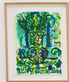
Exhibition view Limonada July 2023